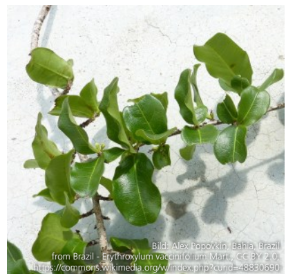
Zweig mit Blättern