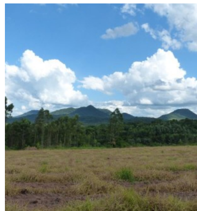
Umgebung der Grundstücke