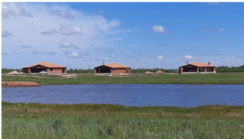
Häuser von der gegenüberliegenden Seeseite