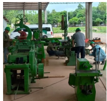
Wartungsarbeiten im Sägewerk