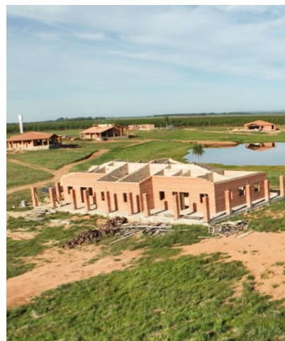
Baustelle von oben

Bei unserem Hausbau-Projekt „Laguna Rivera“ auf dem Grundstück in San Salvador sind zur Zeit sieben Häuser im Bau, einige davon sind kurz vor der Fertigstellung. In den ersten Häusern läuft auch bereits der Innenausbau. Auf den anderen Grundstücken laufen noch die Planungsarbeiten und der Baubeginn steht kurz bevor. Individuelle Wünsche der Grundstückseigentümer werden in enger Zusammenarbeit mit unserem deutsch-paraguayischen Architektenteam geplant und umgesetzt. So entsteht für jeden das ideale Haus, das zum Gesamtkonzept passt und sich harmonisch in die Landschaft einfügt. Alle Häuser haben eine Dachkonstruktion aus Holz, die sichtbar