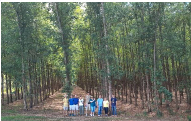
Eukalyptus-Anpflanzung „Bella Vista“