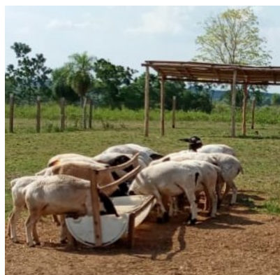
Fütterung der Jungschafe