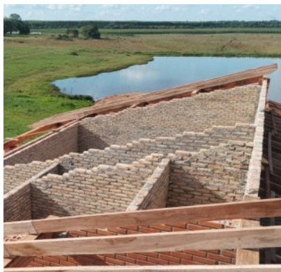
Blick zum See