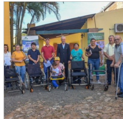
Spendenaktionen der letzten Monate an verschiedene Einrichtungen in Villarrica und Umgebung