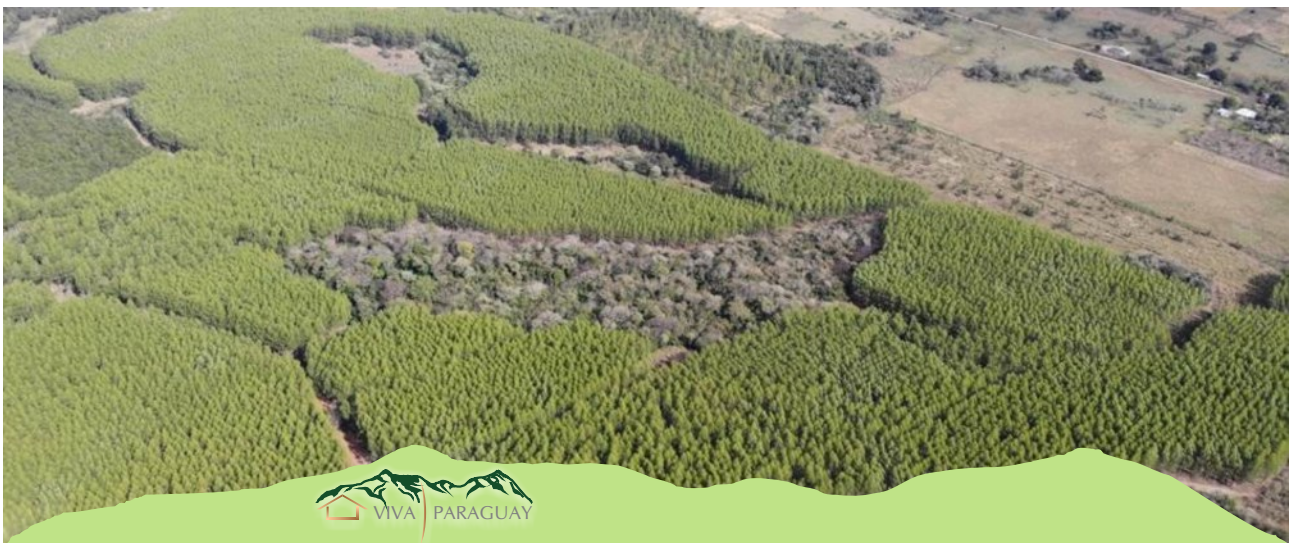
Lage der Baugrundstücke

488 Baugrundstücke zu verkaufen – mit direkter Online-Reservierung