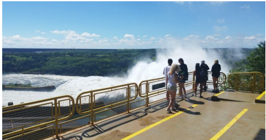
geöffnete Schleusen am Wasserkraftwerk Itaipú