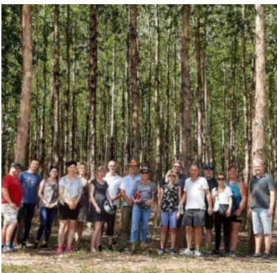
Estancia „Bella Vista“