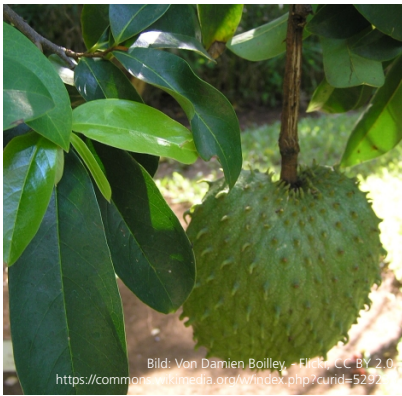
Frucht und Blätter

als Saft und Püree, oft auch als Grundstoff für Getränke, Eis oder Marmeladen. In der Karibik werden fermentierte Blätter als Tee verwendet. Die Früchte enthalten Antioxidantien, die Augenerkrankungen lindern können, Extrakte aus den Blättern haben eine entzündungshemmende und antimikrobielle Wirkung. Frucht auszüge der Graviola wurden auch erfolgreich zur Wachstums- hemmung bestimmter Krebszellen eingesetzt.