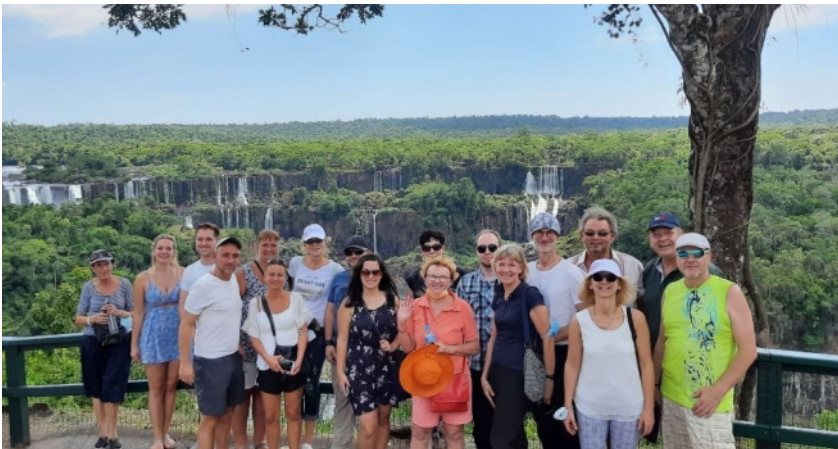
An den Iguazu-Wasserfällen