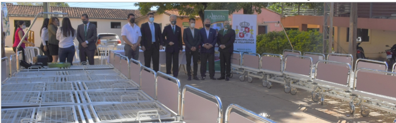
Dringend gebrauchte 15 Krankenhausbetten