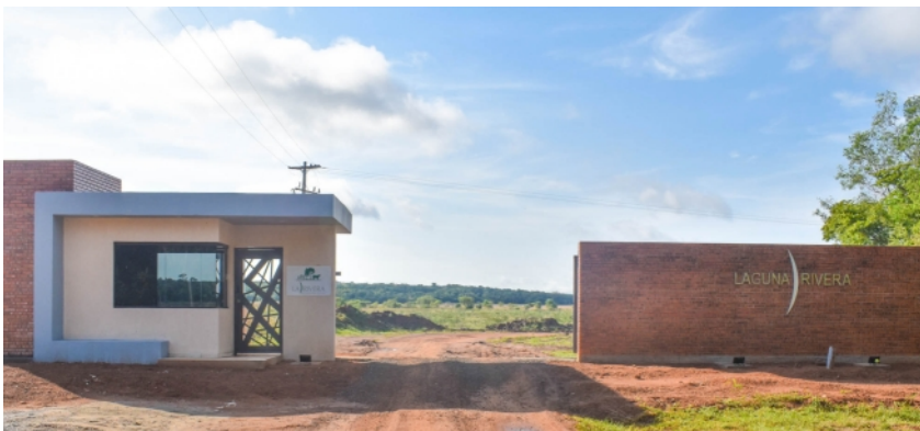
Neues Eingangstor für „Laguna Rivera“ in San Salvador

In unser Bauprojekt beziehen wir auch lokale Arbeiter mit ein, um ein Gefühl der Zugehörigkeit zu dem