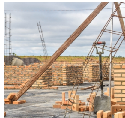
Fünf Häuser gleichzeitig im Bau