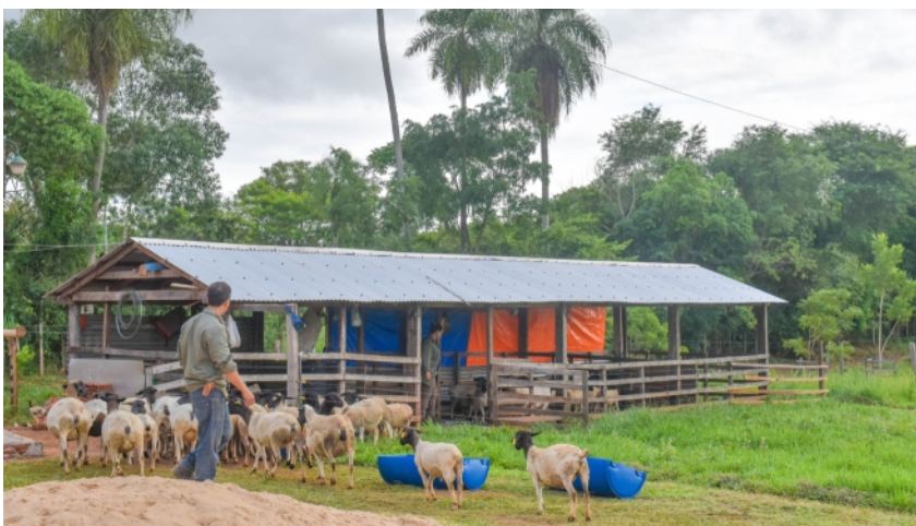
Schafzucht der Rasse „Dorper“

Einige unserer Grundstücke werden zusätzlich zur Aufforstung auch mit Tierhaltung ergänzt. Dies erfolgt nach dem Prinzip „Silvo Pastoral“ oder Waldweide, dieses hatten wir in Ausgabe Nr. 34 des Substanz-Reports ausführlich beschrieben. Auf dem Grundstück „Bella Vista“ sind im April 50 weibliche und auf „Coronel Martinez“ sind 24 männliche Jungrinder angekommen. Eine weitere, von der La Rivera S.A. im Auftrag bewirtschaftete Estancia hat mit der Schafhaltung begonnen. Dort leben bisher 58 Tiere.