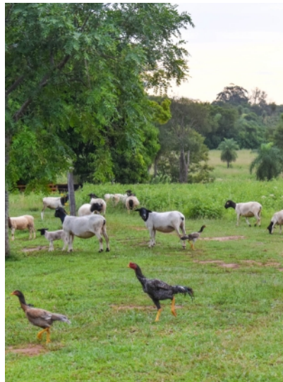
glückliche Schafe und Hühner

Auf den relativ neuen Grundstücken „Iturbe 1“ und „Iturbe 2“ finden aktuell die Vorbereitungen zur Bepflanzung statt. Es werden die Außenzäune, Wege und Brücken gebaut. Das Haus des Vorarbeiters (Capataz) und der Tiefenbrunnen