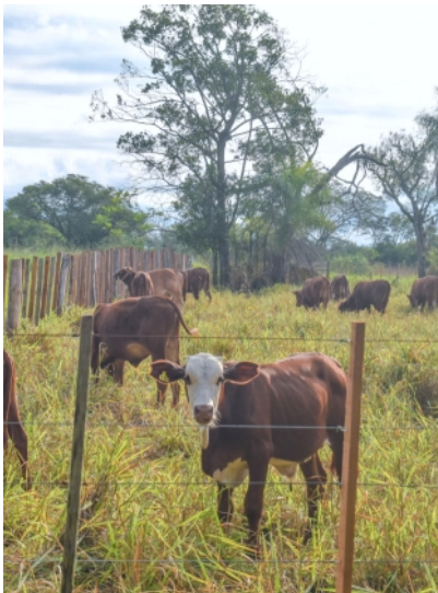
Jungbullen auf der Estancia Coronel Martinez (Fläche der Green Value SCE)

Auf unseren bepflanzten Flächen wachsen und gedeihen die Bäume großartig und auf den neu hinzugekommenen Grundstücken laufen zur Zeit die Vorbereitungen zur Anpflanzung.