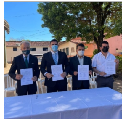
Betten für das Hospital Regional in Villarrica, Übergabeurkunde mit Vertretern des Gouverneurs, Gesundheitsdistrikt Nr. 4 und dem Bürgermeister der Stadt Villarrica