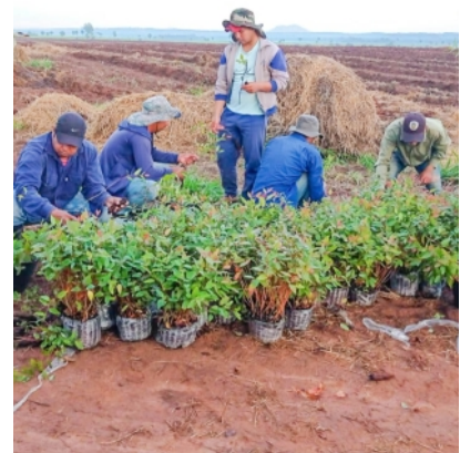
Vorbereitung der Setzlinge zum Pflanzen